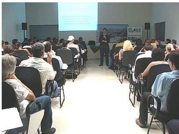
Auditório da ACE ficou lotado de profissionais do setor contábil